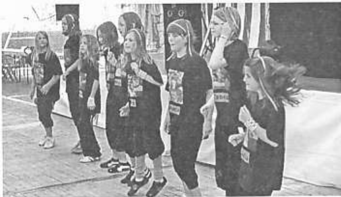
Die Hip-Hop-Gruppe beim Wendener Volksfest

Nicht in der Manege, sondern auf verschiedenen Bühnen, hatte unsere Hip-Hop-Tanzgruppe, die "Neon Dance Stars", ebenfalls weitere erfolgreiche Auftritte. Zur Braunschweiger Spielmeile im Juni tanzten die Mädchen "auf der Platte" am Ringerbrunnen in der Braunschweiger Fußgängerzone und auf heimischen Boden tanzte die Gruppe zum Wendener Volksfest. Gleich nach den Sommerferien ging es weiter. Anfang August feierte die DRK Krippe in der Weststadt ihre Einweihung, zu der die Hip-Hop-Mädchen mit einer Tanzeinlage gratulierten.